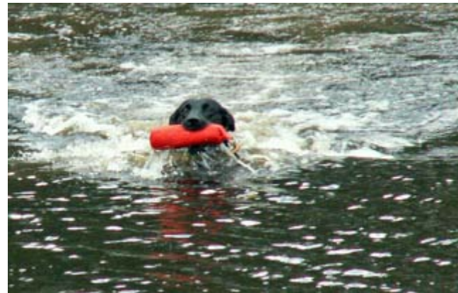
Nian på väg hem med 1 av 3 på vattenmarkeringarna. Här kunde de simma på vissa ställen.