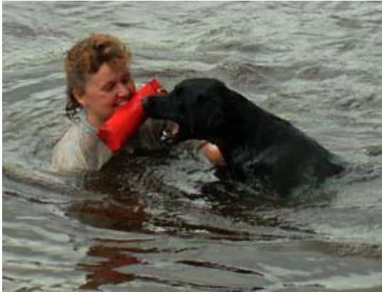
Den vill jag ha tycker Duvkullans Orre