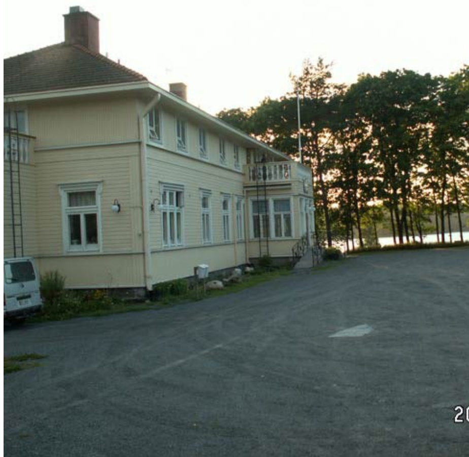
Kvälls sol från våran lägenhet.