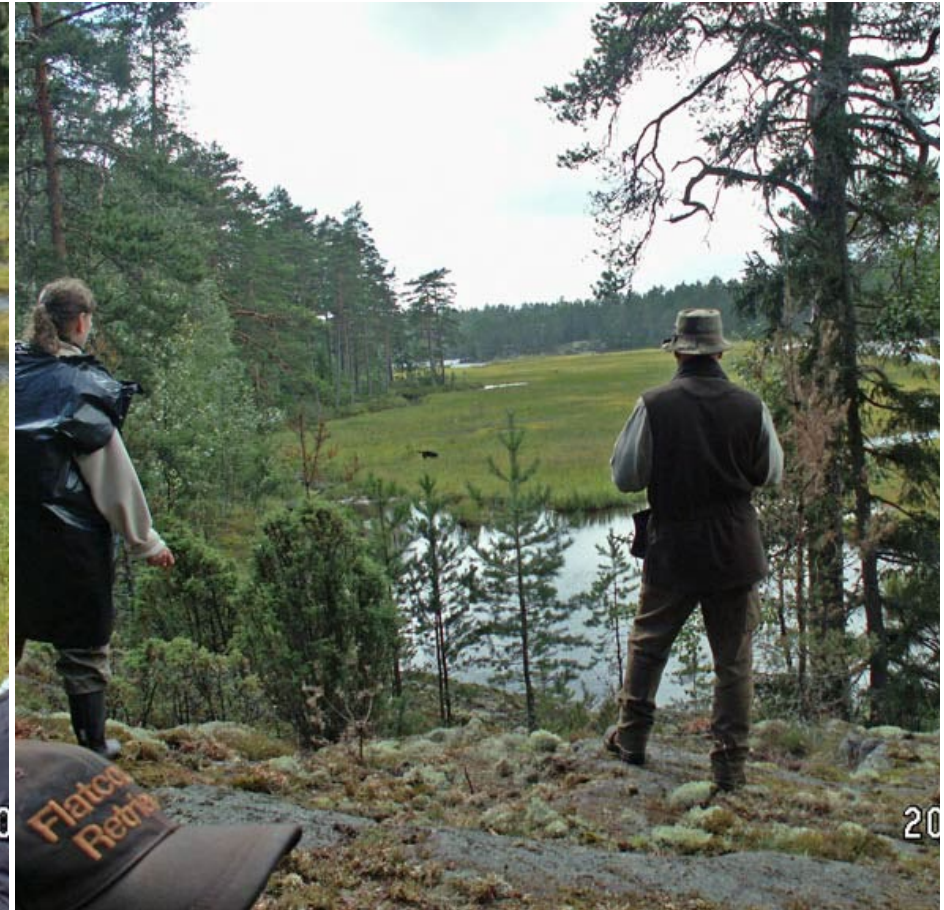
Domaren med hatt och en funkis. Den vänstra delen av provet