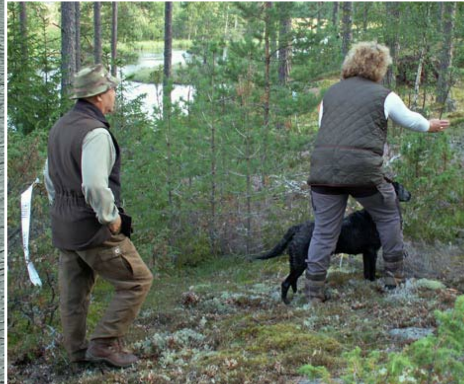
Så var det söndag. Här skickar jag på en landdir. Jag är jättenöjd med Nians arbete på söndagen men fick en 2:a på grund av att jag gjorde inkallning med armarna på en av markeringarna. Där "rök" 1:an.