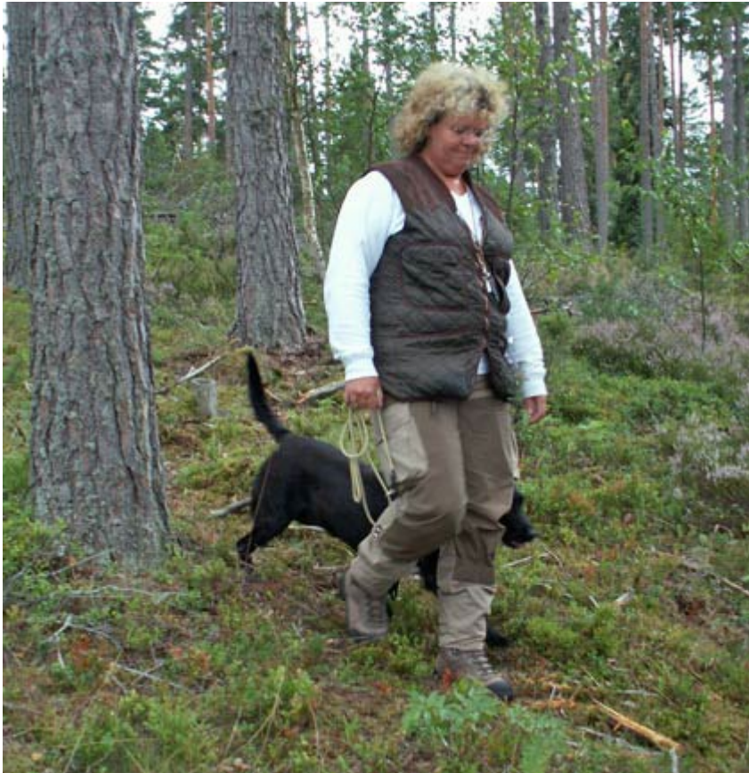
Nian och matte på väg till start