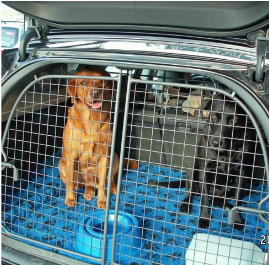
Väntan vid färjan i Stockholm