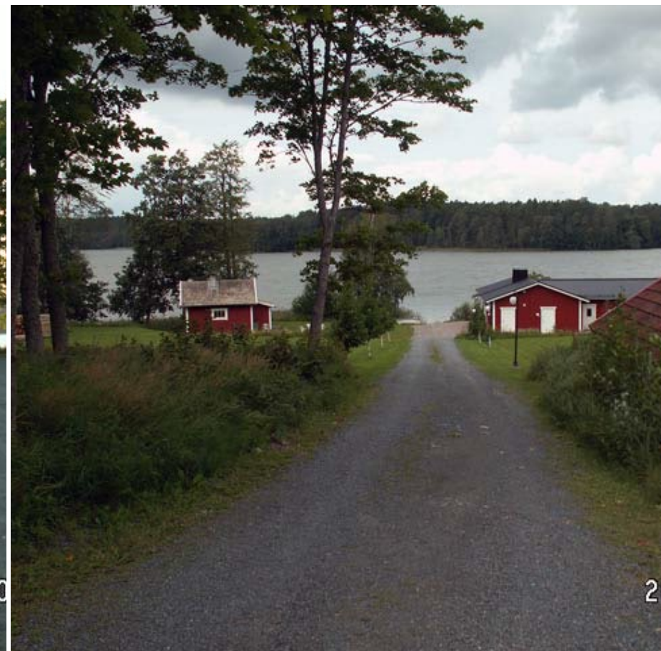
Naturligtvis fanns det bastu. Dessa 2 låg nere vi havsviken.