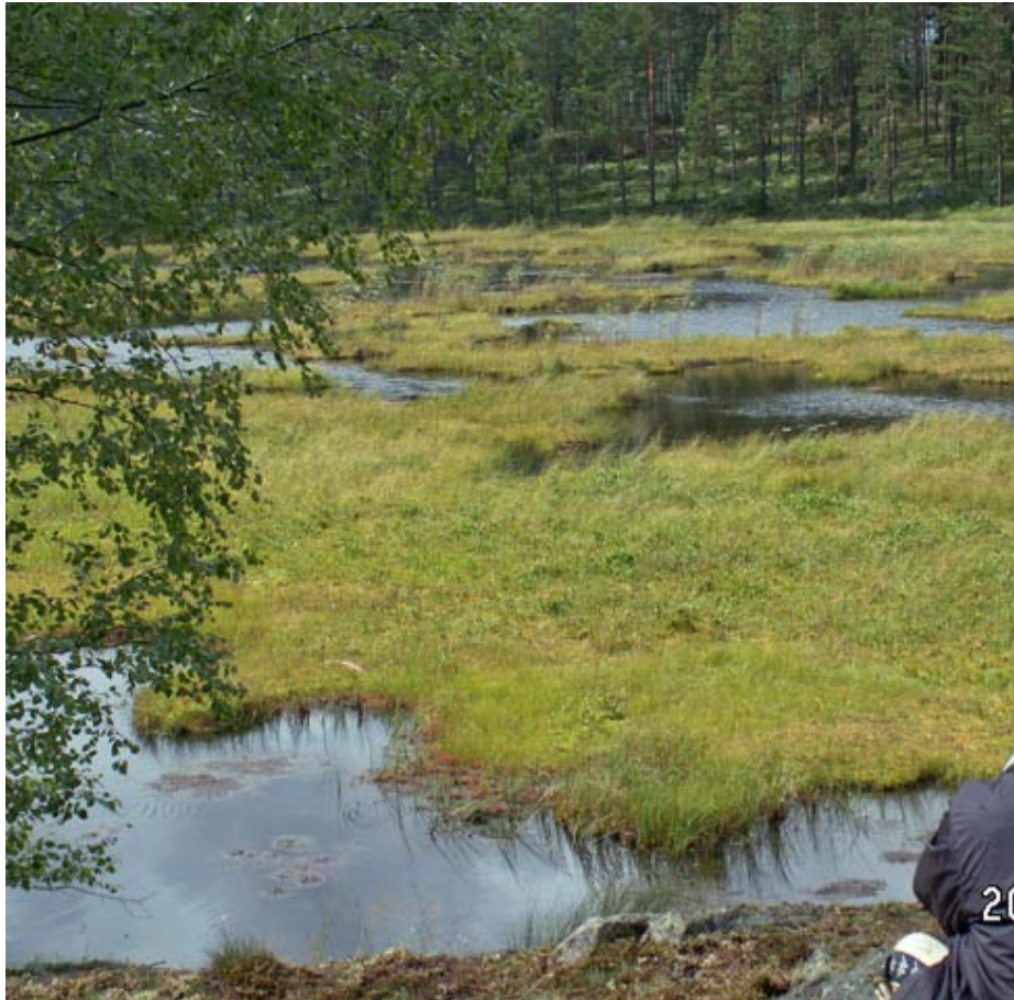
Prov markerna i Finland. Den mittre delen !!!