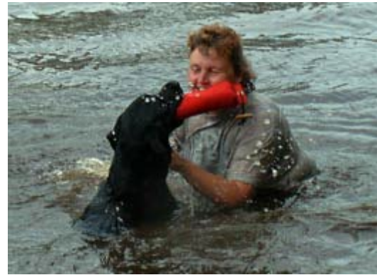
Nu "matte" har vi den båda två